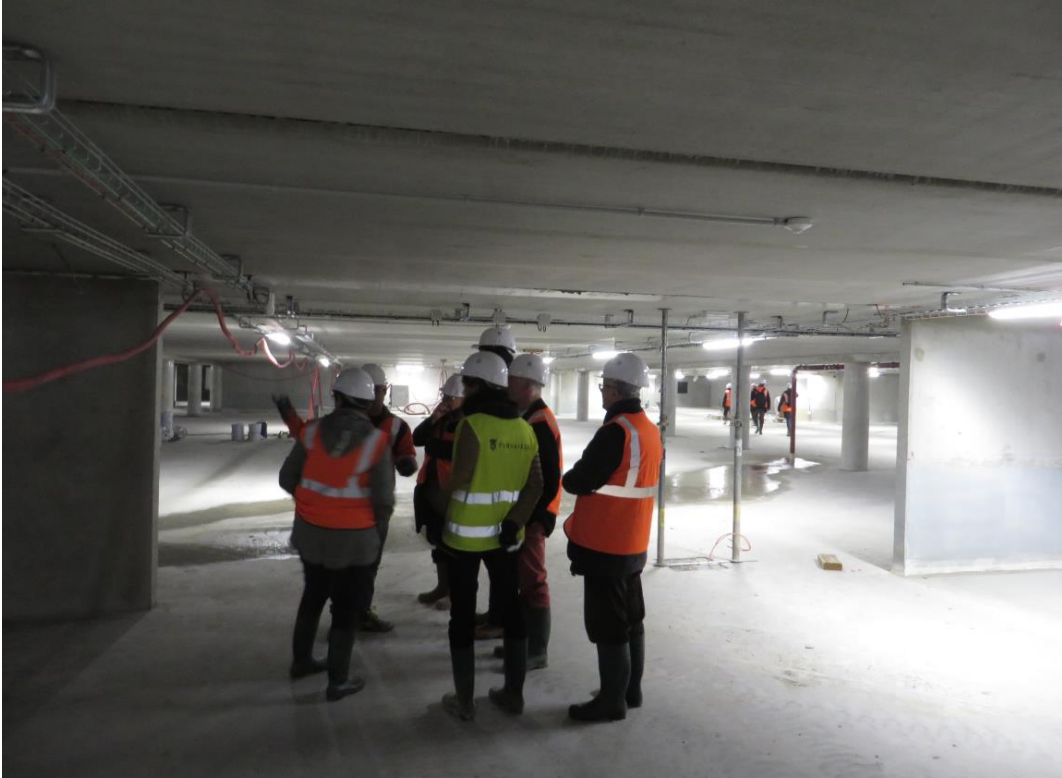
Séparateur en cas d'incendie, coupe la surface en deux zones