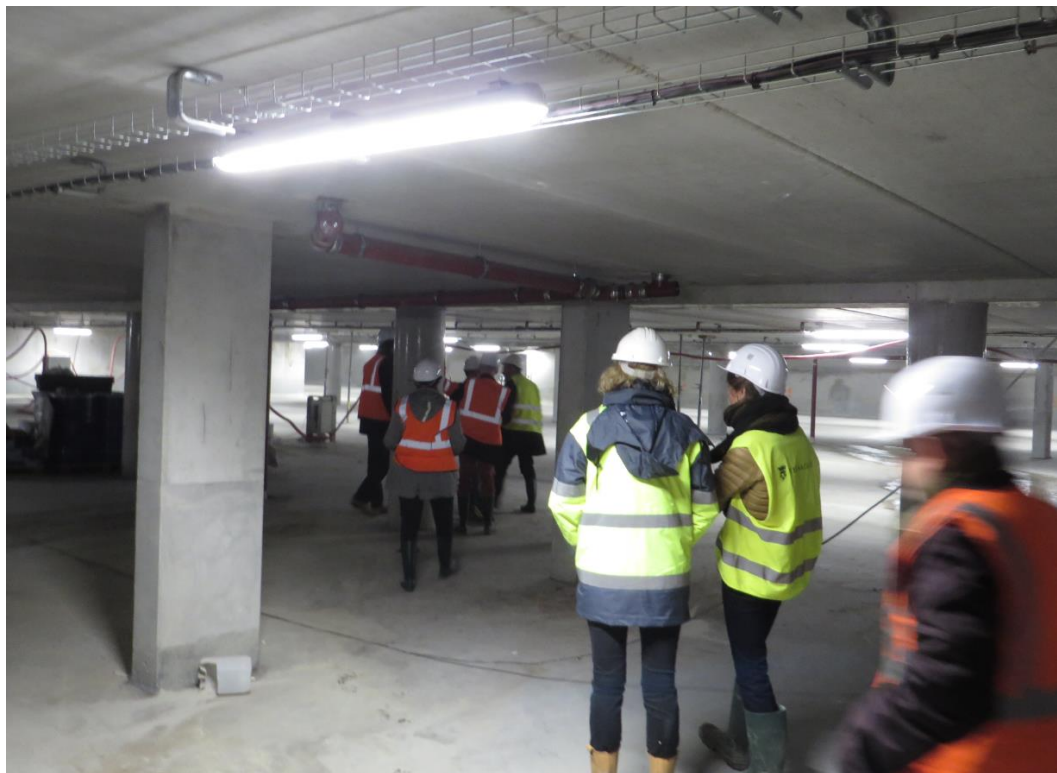
Des canalisations d'évacuation des eaux du 1 niveau , montage singulier. Ne devait pas être dans les plans.