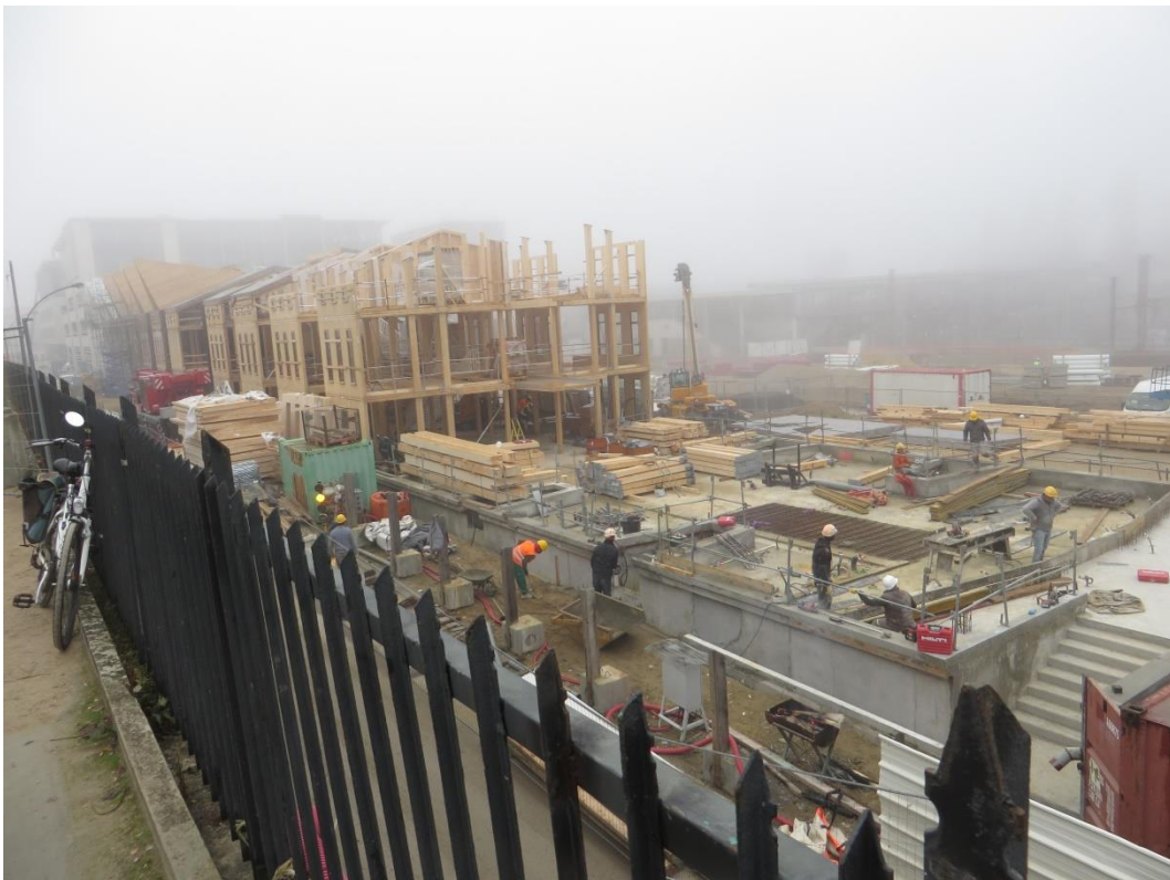
Nature et Découverte