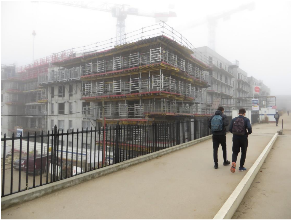
Ilot Ouest, maison de retraite qui donne sur la gare routière et à droite les logements.