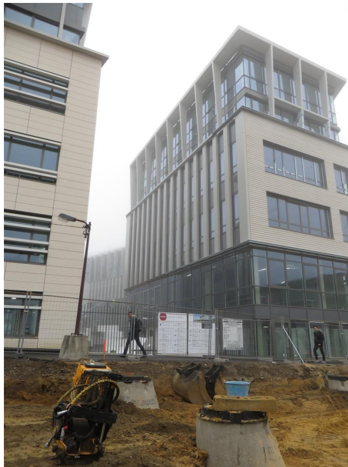
Ilot EST, à gauche la CAF,